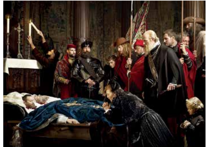
Últimos honores a Egmont y Hoorn, por Louis Gallat (Museo de Brooklyn)

Había nacido el 18 de noviembre de 1522 en la provincia de Hennegau, actual Bélgica. Egmond, o Egmont, sirvió tanto al