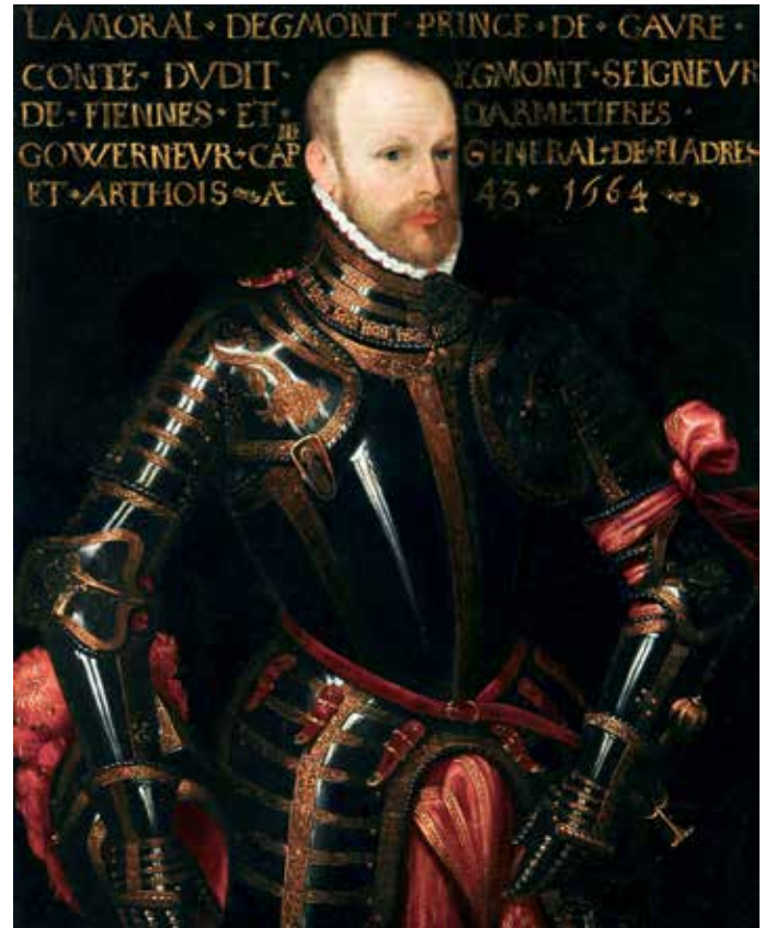
El Conde de Egmont

Como suele suceder, la Obertura ofrece una visión general del drama a representarse. Comienza con los graves y patéticos