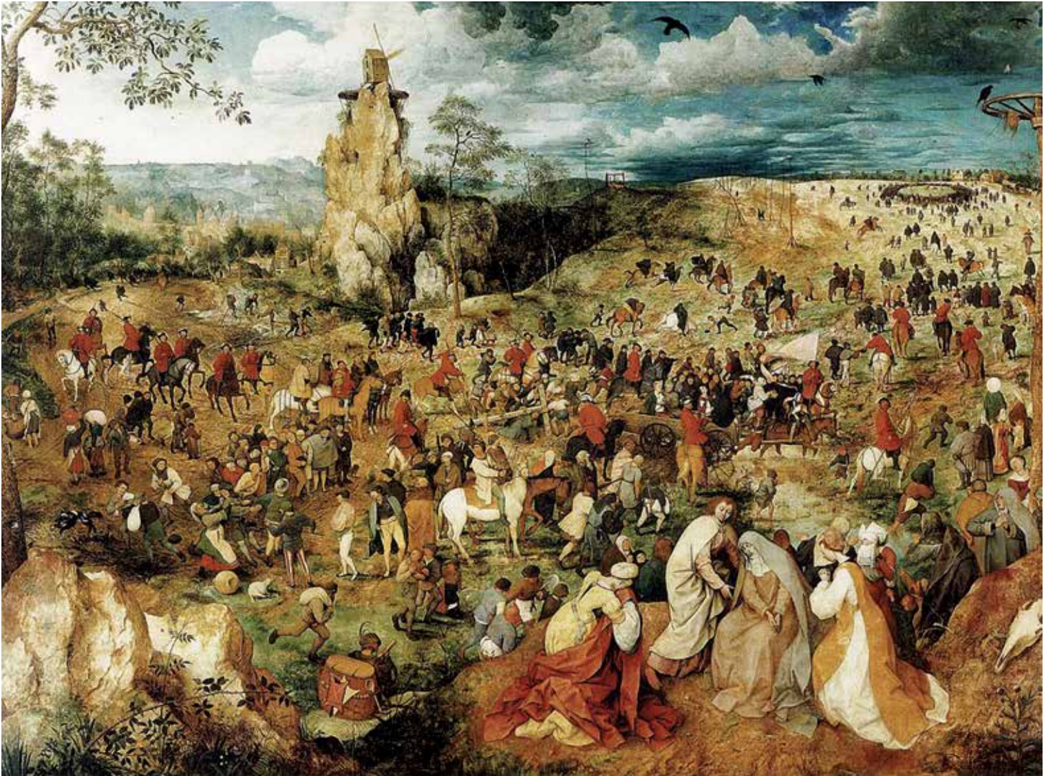
Camino al calvario , por Pieter Bruegel "el viejo".

La pintura alude a la represión española en Flandes bajo la corona de Felipe II.