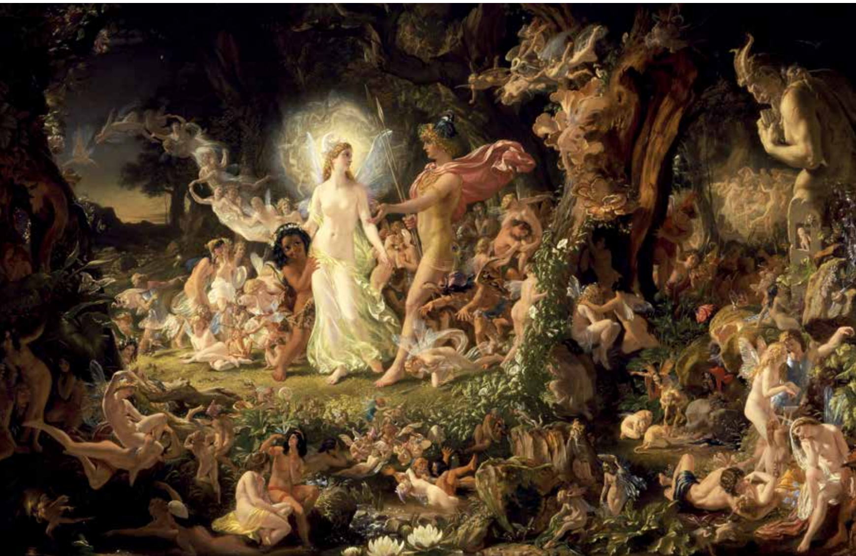
La discordia entre Oberon y Titania, por Sir Joseph Noel Paton.

de exhumar La Pasión según San Mateo , el mundo comenzó a conocer a Bach; que recorrió las ciudades más importantes de Alemania e Inglaterra (cuentan que la reina Victoria había aprendido sus Lieder ), donde junto a sus composiciones contribuyó a difundir la obra de Mozart, Haydn y Beethoven; que en su papel de pianista, con un estilo alejado del virtuosismo en boga, se convirtió en un destacado intérprete de los conciertos de Mozart y Beethoven, además de aquellos de su propia autoría.