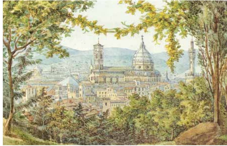
Afición a la pintura: Vista de Florencia , acuarela de Felix Mendelssohn Bartholdy (1830).

La pieza fue muy útil al compositor, cuando 12 años más tarde debió concebir la música incidental para la comedia de Shakespeare, con motivo de una producción en el Neuer Palais de Potsdam. Aquello que añadió a su composición juvenil ( Scherzo , Intermezzo , Notturmo , partes vocales, la famosa Marcha Nupcial , la Danza de los rústicos o la música de los Melodramas ), se corresponde estilísticamente con aquella.