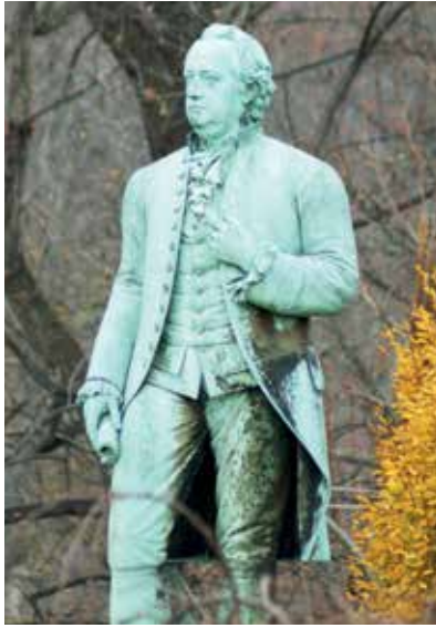
Monumento a Johann Wolfgang von Goethe (Filadelfia)