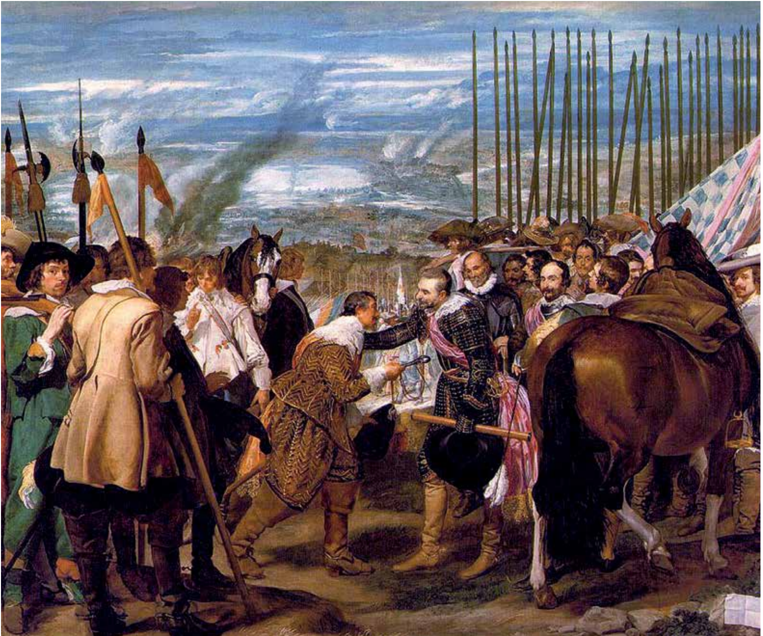
La rendición de Breda (1634) de Diego Velázquez, refleja un momento de la Guerra de los Ochenta Años (Madrid, Museo del Prado).

flamenco, formado con los ideales medievales, no imaginó que el Imperio Español cometiera semejante cosa. Y se equivocó.