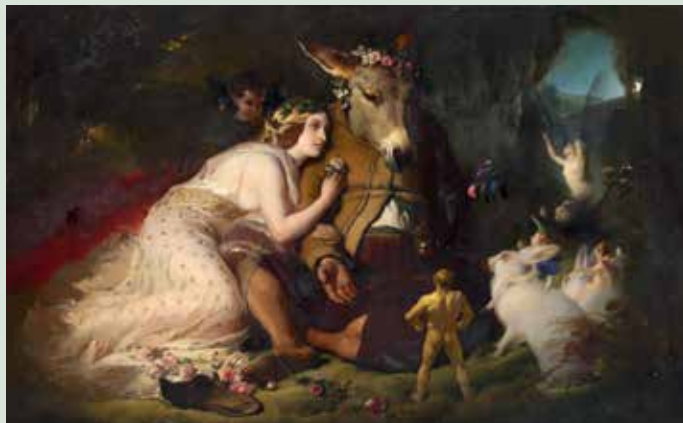
Edwin Landseer: Escena de Sueño de una Noche de Verano (Titania y Bottom) .

Plena de alegría y plena de pena, pensativa; languidecer y sufrir suspendida en el dolor; exultante hasta el cielo, acongojada a morir; solamente es dichosa el alma con amor.