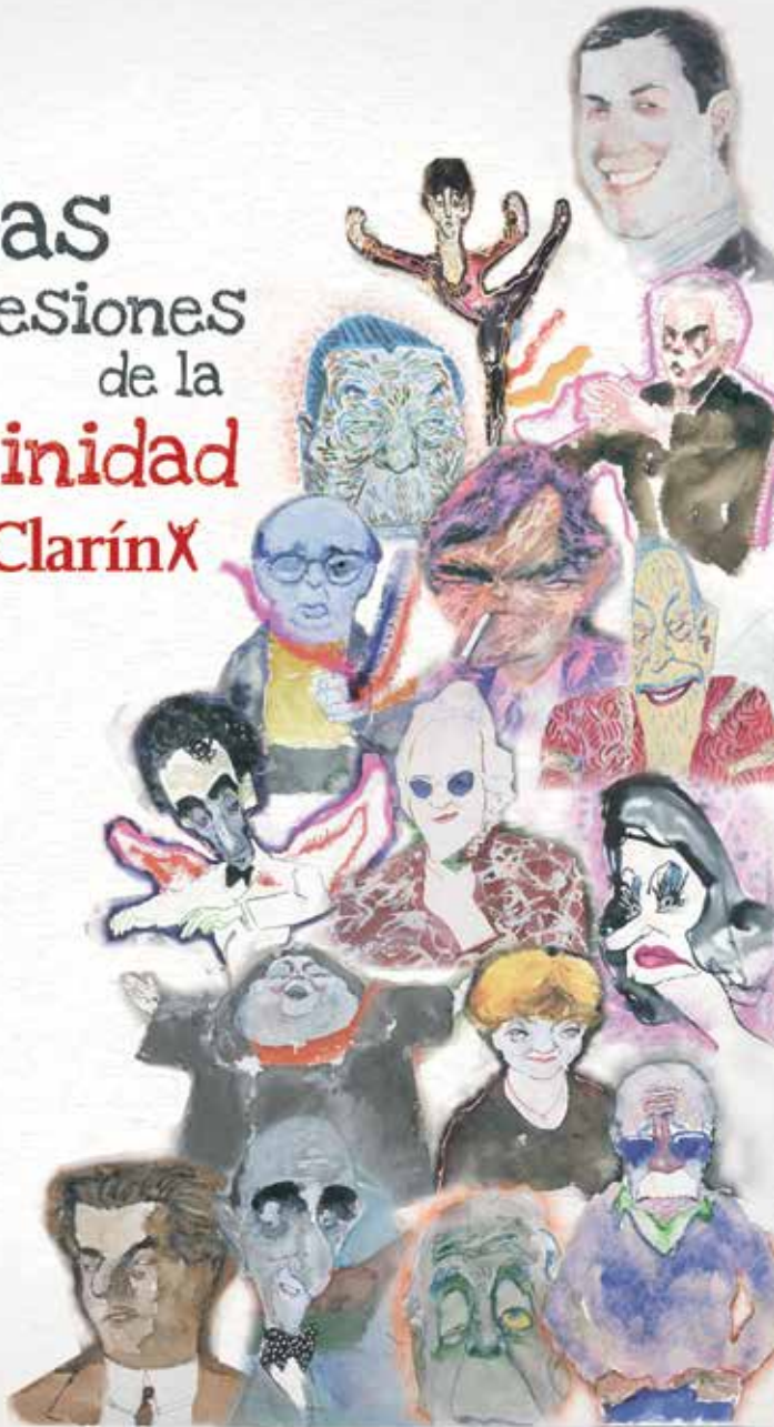
Ilustraciones de Hermenegildo Sábat publicadas en Clarín.

Todas las expresiones de la argentinidad están en ClarínX