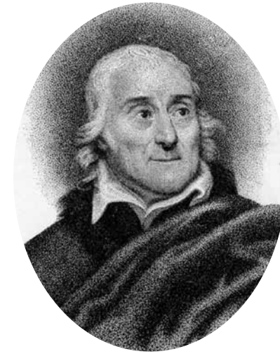
Lorenzo Da Ponte

Pero no había en Viena sino dos que mereciesen mi estima. Martini, el compositor entonces favorito de José II, y Volfango Mozart [...], el cual, aunque dotado de talentos acaso superiores a los de ningún otro compositor del mundo pasado, presente o futuro, no había podido nunca, a causa de las intrigas de sus enemigos, ejercer su divino genio en Viena, y permanecía ignorado y oscuro [...]. Nunca puedo recordar sin regocijo y complacencia que sólo a mi perseverancia y firmeza deben en gran parte Europa y el mundo entero las exquisitas composiciones vocales de este admirable genio. La injusticia, la envidia de los periodistas, de los gacetilleros y más aún de los biógrafos de Mozart, no les permitió otorgar tal gloria a un italiano.” Salvo alguna que otra línea, a lo largo de numerosas páginas no encontramos mucho más que estas palabras que nos ponen ante un sujeto que, con la excusa de hacer público su reconocimiento al genio de Mozart, se ensalza a sí mismo y se lamenta por no haber sido tratado por sus contemporáneos como a él le hubiese gustado. Aunque, a decir verdad, nadie puede quitarle la gloria de haber sido el autor de los textos de Le nozze di Figaro , Don Giovanni y Così fan tutte .