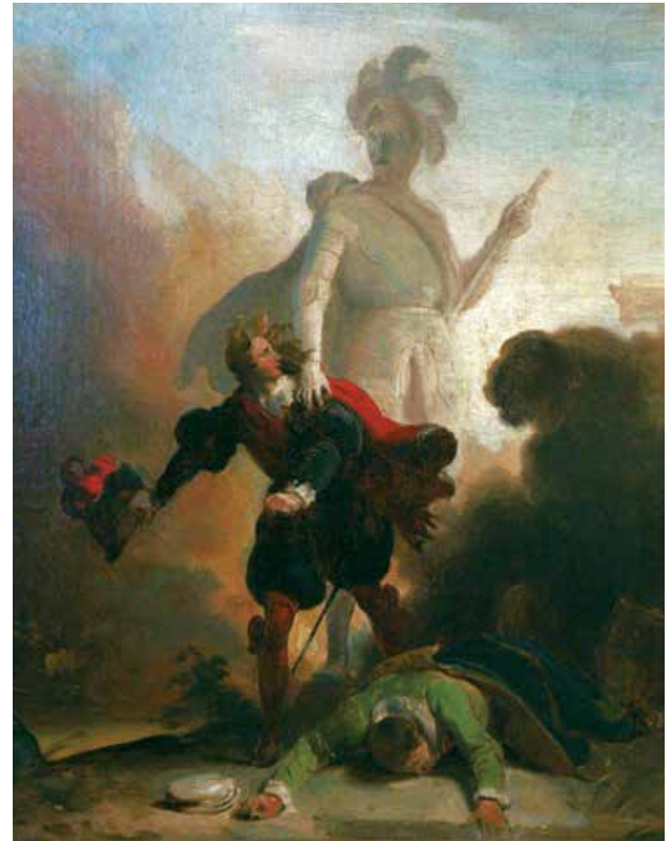
Don Juan y la estatua del Comendador, por Alexandre-Évariste Fragonard (ca. 1830-35)

Es noche de fiesta. Donna Anna, Donna Elvira y Don Ottavio se presentan enmascarados para poner al descubierto a Don Giovanni. Cuando el caballero intenta seducir nuevamente a Zerlina, se arma el escándalo y es puesto en evidencia ante todos. Don Ottavio lo apunta con una pistola, Don Giovanni le echa la culpa de todo a Leporello y ambos consiguen escapar.