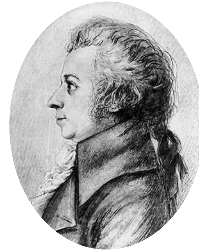
Wolfgang Amadeus Mozart, por Doris Stock.

La ópera que nos reúne se debe al esfuerzo de una de las asociaciones más célebres y fructíferas de la historia del género: Wolfgang Amadeus Mozart (1756-1791) - Lorenzo Da Ponte (1749-1838). Salvo los frutos de su colaboración, poco y nada se conoce acerca de la relación que mantuvieron. Supuestamente existió entre ambos una barrera idiomática que habría limitado la comunicación: nadie asegura que Mozart dominase el italiano al extremo de hablarlo con fluidez, o que Da Ponte supiera alemán (en una Viena donde sus compatriotas manejaban la vida operística, es muy probable que la lengua materna le resultase suficiente). De haber sido así quizás se hayan comunicado en francés, posibilidad viable por la clase de ambientes que solían frecuentar. Tampoco hay pruebas de que entre ambos hubiese amistad y es conocido que en su vejez el poeta esquivaba hablar del compositor, ya glorificado mundialmente (contamos con este dato gracias al médico neoyorquino que atendió a Da Ponte en sus últimos años).