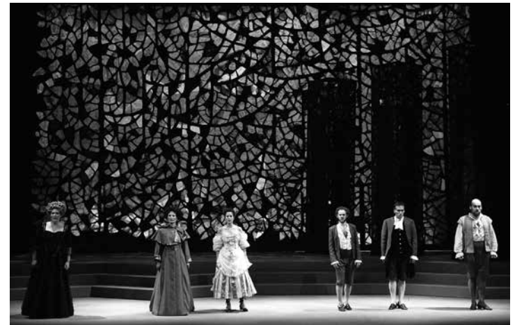
Don Giovanni en Buenos Aires Lírica. Final de la ópera.

Instalado en los Estados Unidos tras una vida novelesca y errabunda, Lorenzo Da Ponte se encargó del estreno de Don Giovanni en ese país. Fue en el Park Theatre de New York el 23 de mayo de 1826, a cargo de la compañía de Manuel García, con su hija María en el papel de Zerlina; la posteridad bautizó a la cantante como “la Malibran”.