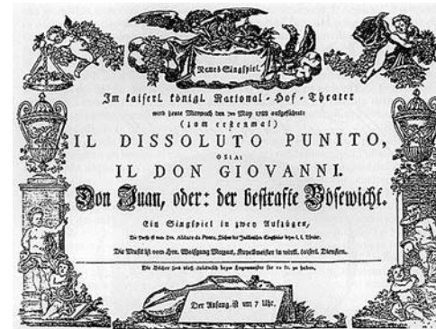
Afiche del estreno de Don Giovanni en Viena.

Se acostumbra decir que Mozart la escribió la noche anterior al día del estreno, mientras Konstanze le servía ponche y le leía fábulas de Perrault. De la casa donde se alojaba, lo escrito fue directamente a las mesas de los copistas y de allí, cada parte a los atriles de los ejecutantes a poco de comenzar la función. Si la interpretación prácticamente sin ensayo de esta pieza tan compleja fue medianamente buena, habrá sido un milagro; pero en realidad no lo sabemos y hasta podemos ponerlo en duda (una crónica del estreno que se leerá más adelante, nos deja conjeturar que durante esa primera noche la ópera fue premiada con el favor de un público tan entusiasta, que si por los pocos ensayos existieron flaquezas, estas fueron disculpadas). Sobre los curiosos procesos mentales de Mozart se dice que solía tener las composiciones perfectamente concebidas dentro de su mente, y que lo único que necesitaba era hacerse del tiempo para volcar todo aquello al papel pentagramado. (¿Hay algo que aún no se haya dicho acerca de la genialidad de Mozart? ¿Algo que haya quedado afuera del tintero a la hora de intentar dilucidar los misterios del genio?)