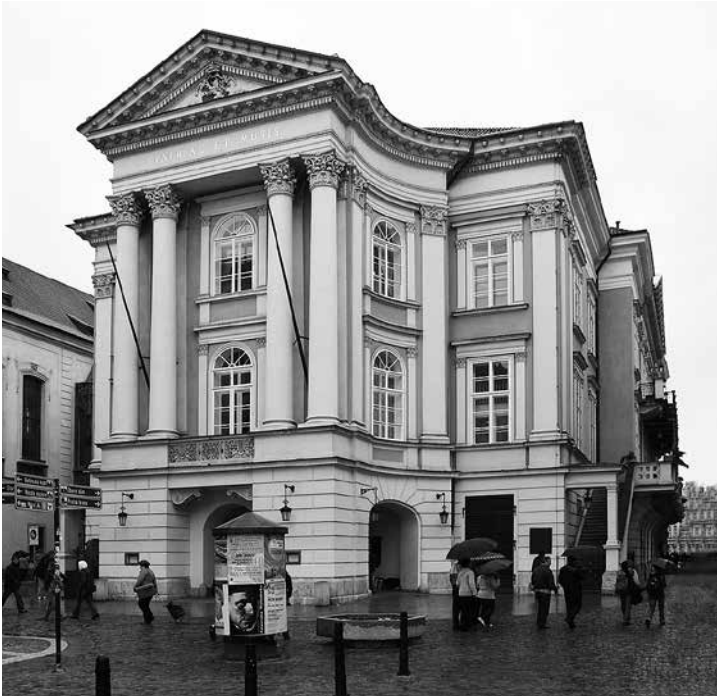
El Teatro Estatal de Praga, donde tuvo lugar el estreno mundial de Don Giovanni .

convitato di pietra de Giuseppe Calegari (Venecia, 1777), entre otras creaciones que trataron el mismo asunto.