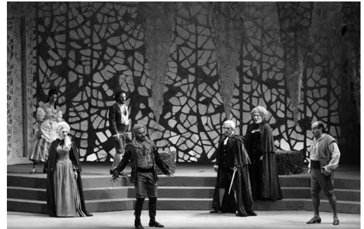
Don Giovanni en Buenos Aires Lírica. Final del acto I.